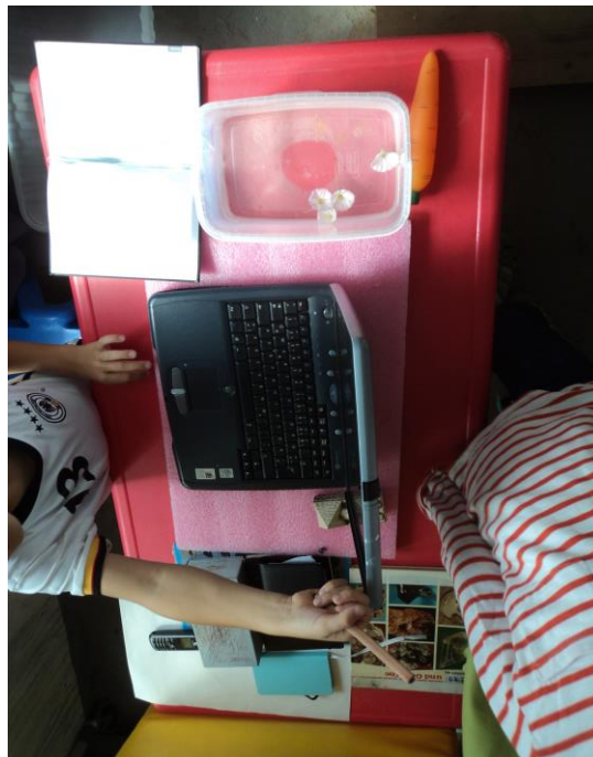
Unsere Schulkinder wurden im letzten Halbjahr zu Museumsgründern.