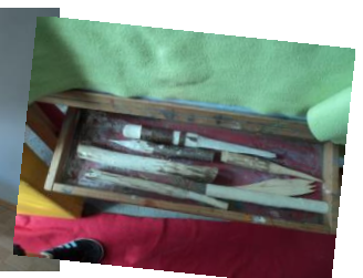
Bobby Car Waschanlage mit Tankstelle. Neues Karussell. Unser Restaurant leiten die Kinder. Neue Klötze im Bauraum. Schnitzkurs mit unseren Praktikanten.