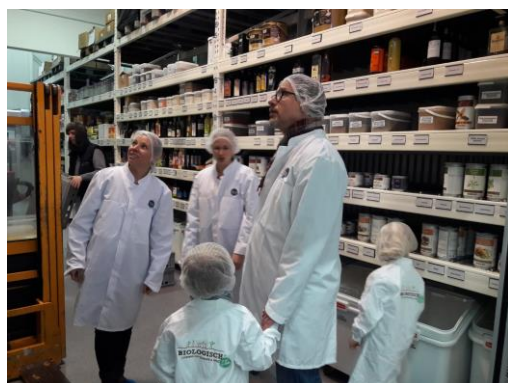
Wo kommt unser Mittag -Essen her.