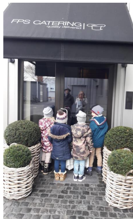
Wir haben unseren Koch getroffen: Er ist freundlich und ruhig.